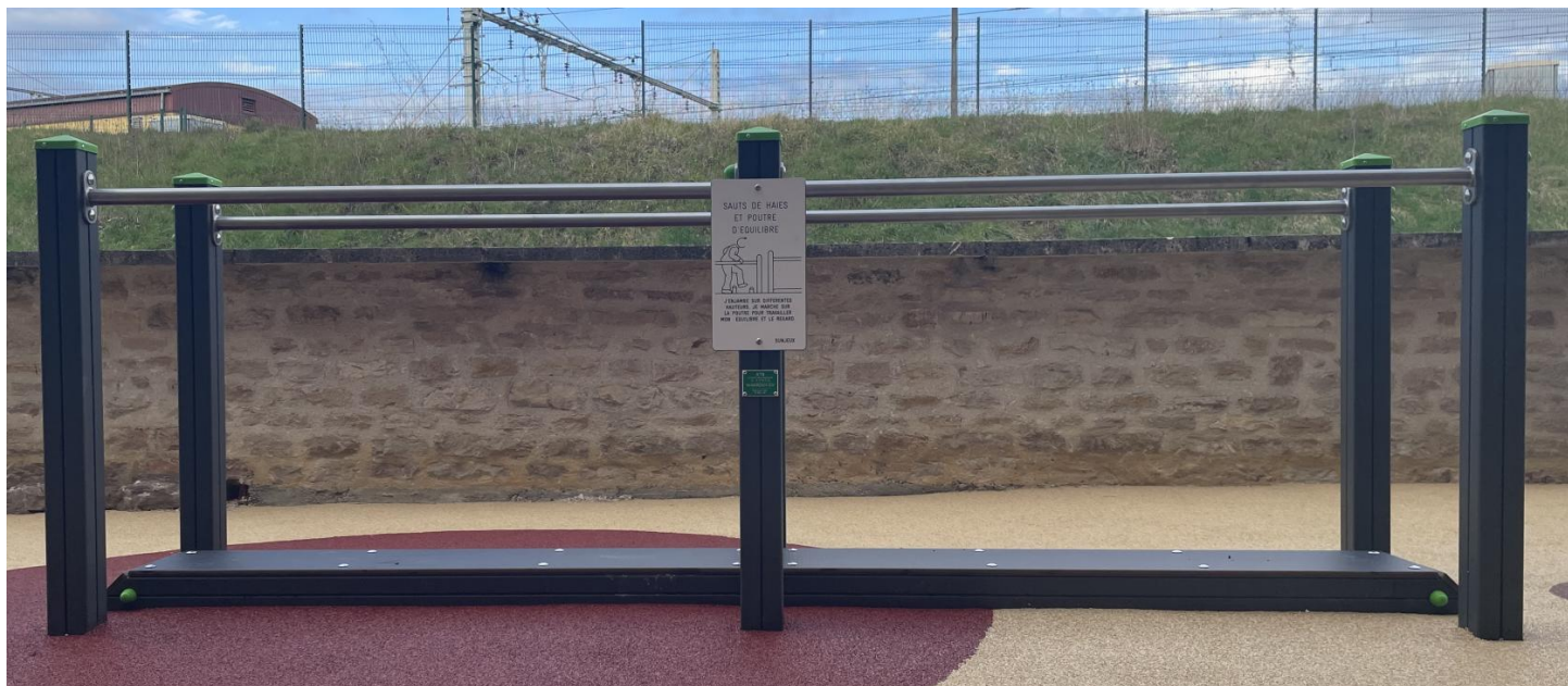
ENPE15Eat : Poutre de 15 cm de large, unité de passage étroite. Fixation sur platines.