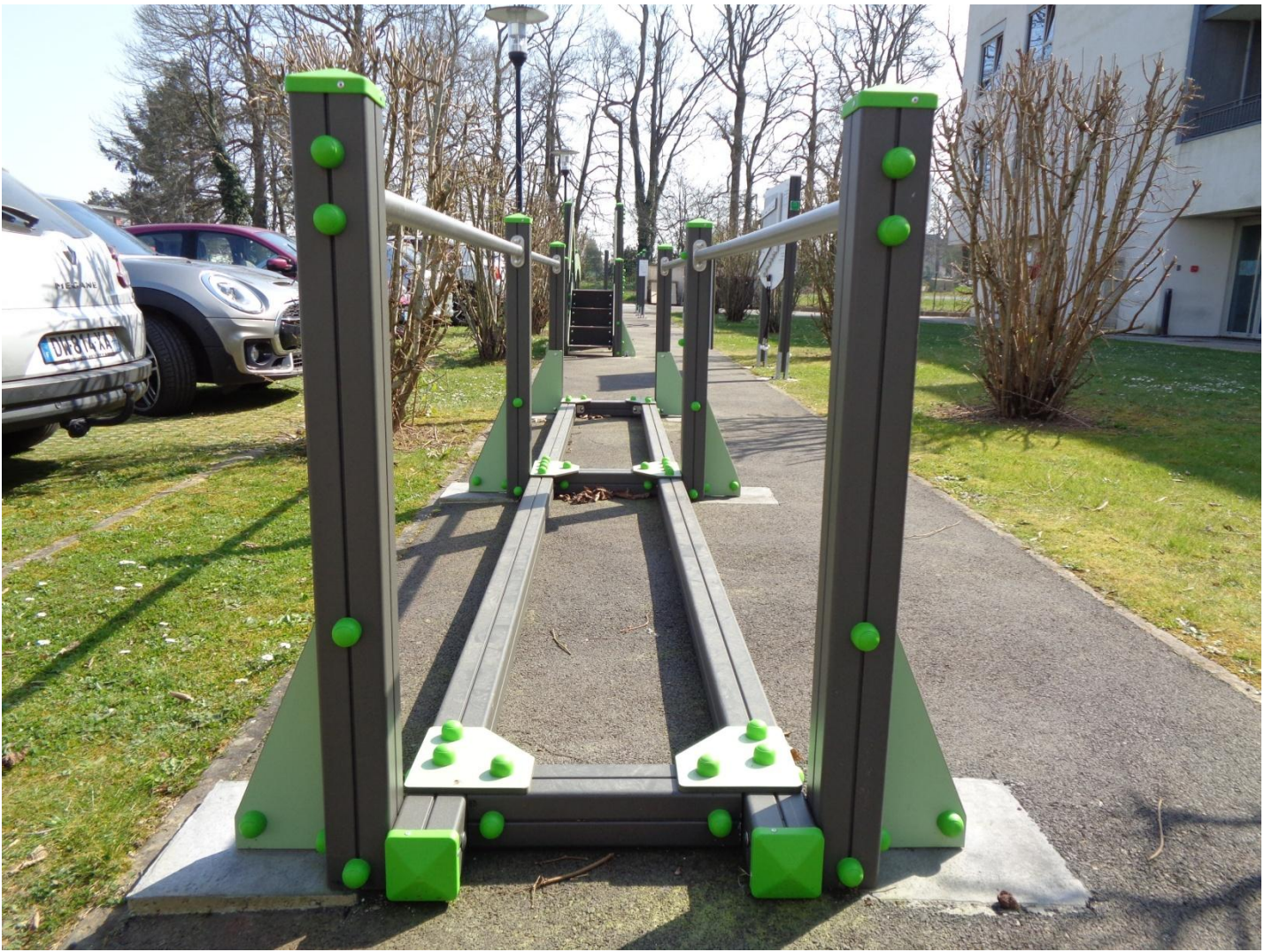
Cette technique permet de rattraper les hors niveaux , comme ici à gauche.