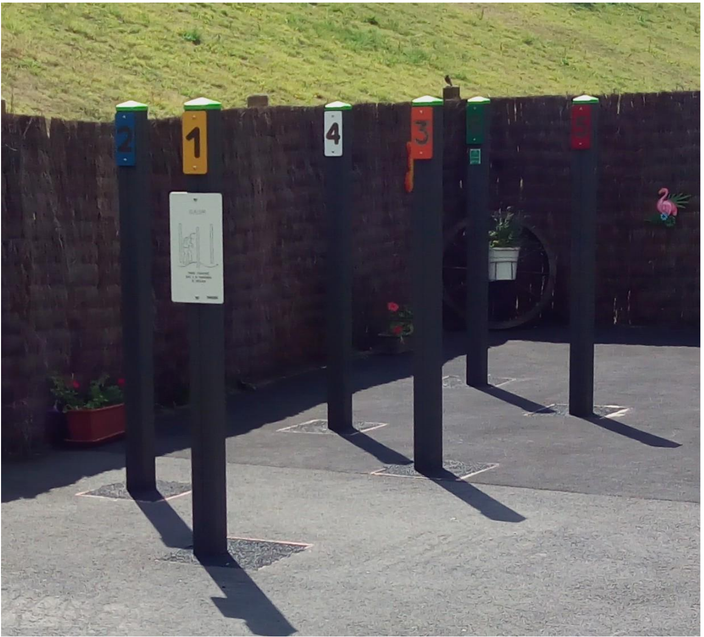
Finition à l'enrobé.