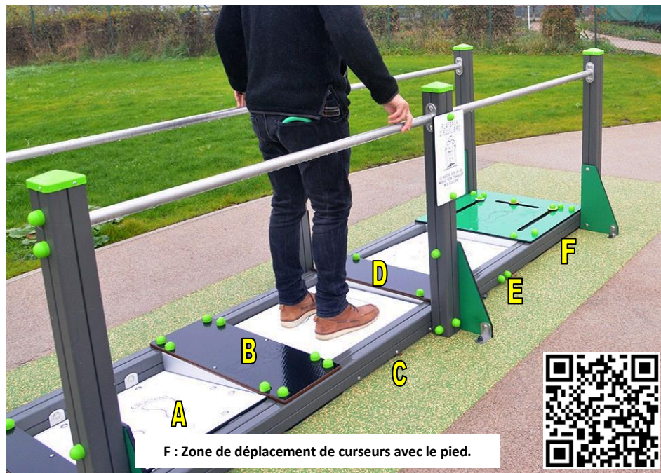
F : Zone de déplacement de curseurs avec le pied.